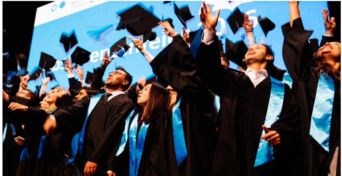
Absolventenfeier im Telekom Dome.

In eigenen Veranstaltungsreihen bietet die Hochschulgesellschaft Formate in denen junge Studierende auf Persönlichkeiten aus Wirtschaft und Gesellschaft treffen, um so in einen gegenseitigen Dialog zu kommen. Und nicht zuletzt möchte die Hochschulgesellschaft ihren Alumni eine Möglichkeit zum regelmäßigen Austausch auch über die Studienzeit hinaus bieten.