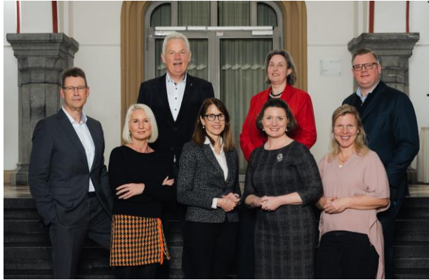
Der Vorstand der Hochschulgesellschaft.

„Die Hochschule Bonn-Rhein-Sieg hat seit ihrer Gründung am 1. Januar 1995 als technische Hochschule für die Region eine dynamische Entwicklung genommen. Davon zeugen die derzeit rund 9.000 Studierenden, das breite, auch stark interdisziplinäre auf 5 Fachbereiche angewachsene Lehrangebot in rund 40 Studiengängen, die erfolgreich angesiedelten Forschungseinrichtungen, das Gründerzentrum und nicht zuletzt die zahlreich gewonnenen Auszeichnungen. Man kann zu Recht davon sprechen, dass dem Gründungsgedanken, sich als „Motor der Entwicklung der Wissenschaftsregion Bonn zu etablieren“ ausgezeichnet Rechnung getragen wurde und wird.“