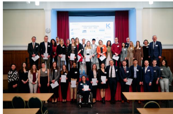
Förderpreisverleihung 2020 – 2021 - 2022.