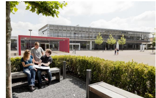
Hochschule Bonn-Rhein-Sieg, Campus St. Rheinbach.